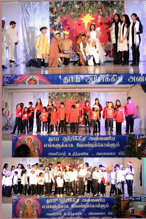
Xmas Oli Vizha & Tamil Heritage Month Celebrations